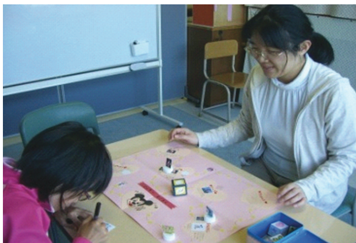
(通級指導教室の個別指導)