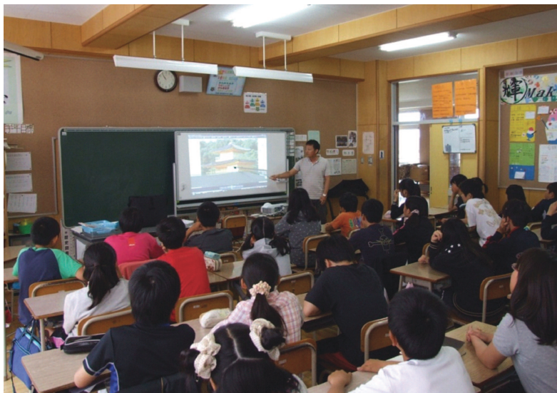
(電子黒板を活用した授業)