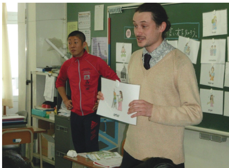
(外国語指導助手：ALT による英語活動授業)