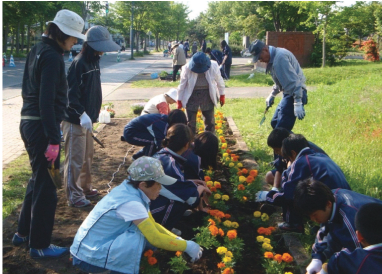
(地域の方と一緒に花壇づくり)