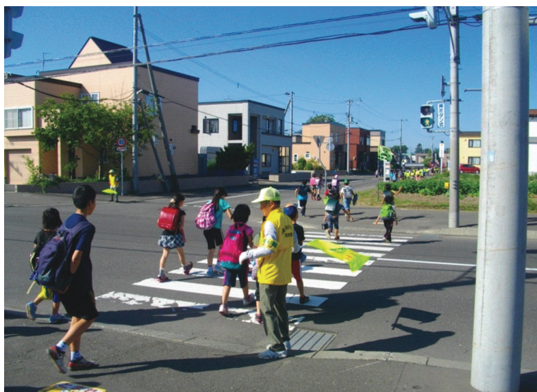
(児童の登校時の地域ボランティア交通安全街頭指導)