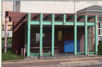
第二中学校前バス待合所