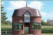
酪農学園前バス待合所