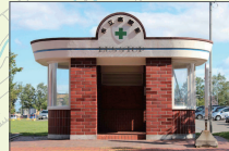
市立病院前バス待合所