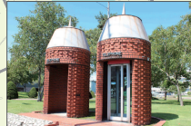
江別市役所前 サイロ型の電話ボックス