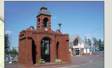
豊幌駅前電話ボックス