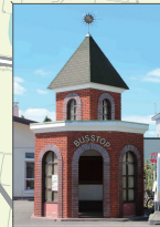
東光町南 バス待合所