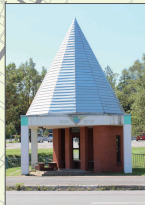
情報大学前 バス待合所