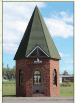
とわの森三愛高校前 バス待合所