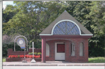
札幌学院大学・北翔大学前 バス待合所