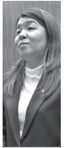
公明党 いしかわ あさみ 石川 麻美 議員