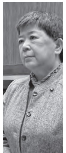
日本共産党議員団 吉本 和子 議員 よしもと かずこ