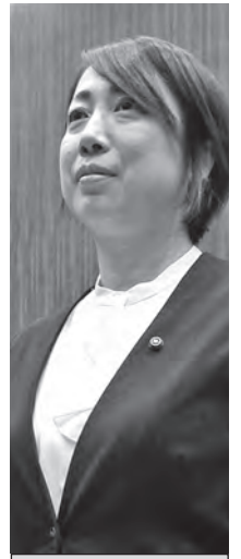
公明党 三吉 芳枝 議員 みよし よしえ