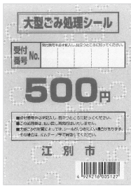
▲大型ごみ処理シール

長さ1mを越えるものや暖房器具など発火の危険があるものは、事前に大型ごみ受付センター（☎ 380-6000）に申し込みをしてください。その後、打ち合わせした場所に「大型ごみ処理シール」を貼って出してください。