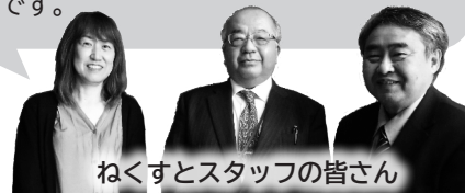
ねくすとスタッフの皆さん

場所が変わると、取り組みも変わります。子どもたちと一緒によりよい居場所づくりをしていきたいです。