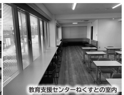
教育支援センターねくすとの室内