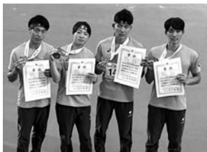
立命館慶祥高校 男子400mリレーチーム

第57回全日本私立高等学校選抜ソフトテニス大会 女子の部団体戦 第3位【ソフトテニス】