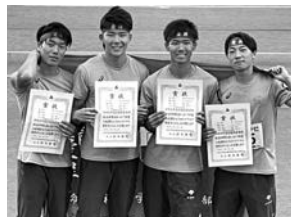
立命館慶祥高校 男子1600mリレーチーム

令和5年度全国高等学校総合体育大会陸上競技大会兼秩父宮賜杯第76回全国高等学校陸上競技対校選手権大会男子4×100mリレー 第2位【陸上】