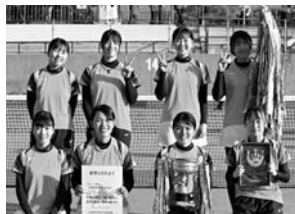
とわの森三愛高校 女子ソフトテニス部

第57回全日本私立高等学校選抜ソフトテニス大会 女子の部団体戦 第3位【ソフトテニス】