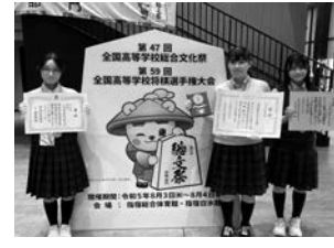
立命館慶祥高校 女子囲碁・将棋部

第47回全国高等学校総合文化祭兼 第59回全国高等学校将棋選手権大 会 女子団体 準優勝【将棋】