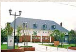
江別市郷土資料館