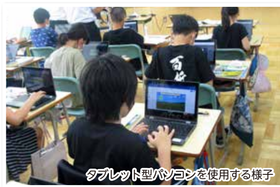
タブレット型パソコンを使用する様子