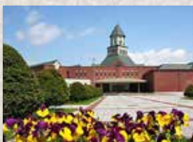
江別市セラミックアートセンター