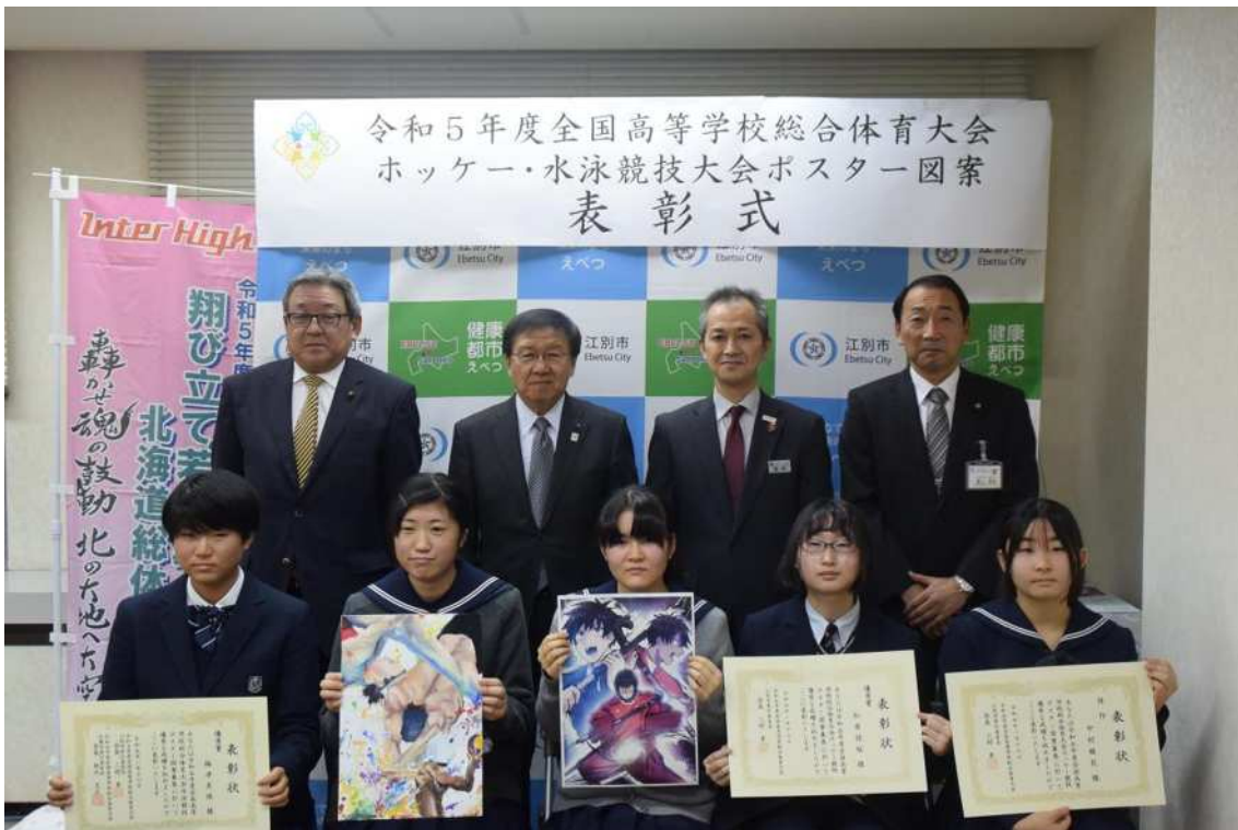
入賞者表彰式 令和5年1月16日(月)