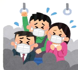
混雑した乗り物の中