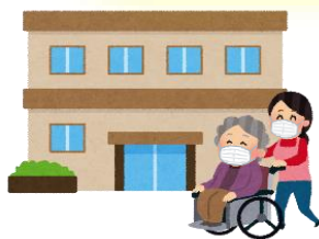
高齢者施設など に行くとき