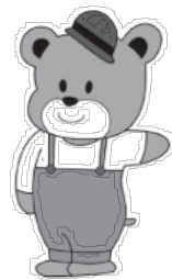
情報図書館 イメージキャラクター 「ほんた」

● ちむほんたのしかけ絵本お はなし会 日 2月12日(出) ① 10時30分～10時50分 ② 11時～11時20分 ￥ 無料 所 申 情報図書館 ☎ 384・0202