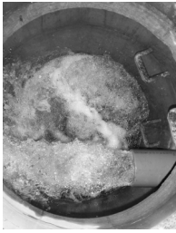
▲ 洗管作業で大量の水を流している様子

この作業を行うことで折損事故の漏水などで、急に水量が増えた場合でもにこらずに水道を使うことができます。