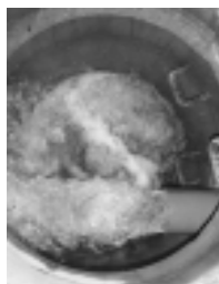
▲ 洗管作業で大量の水を流している様子

この作業を行うことで折損事故の漏水などで、急に水量が増えた場合でもにこらずに水道を使うことができます。