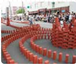
れんがドミノ(えべつやきもの市)▶

良質な陶土と 豊富な木材により レンガの製造など 窯業産業で拓かれた 歴史を持ちます