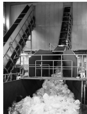
袋に入ったままのペットボトル。コンベアで2階の袋を破く機械へ。