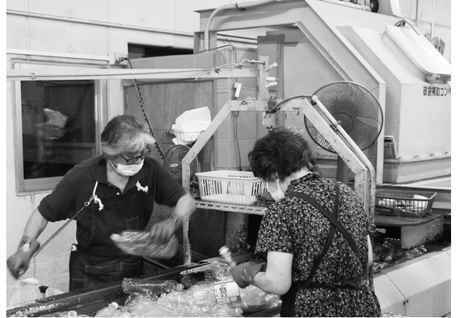
手作業でラベルやキャップを外す作業中。ラベルやキャップがついたままのペットボトルが次々と流れてきて、作業する手が止まることはありません。