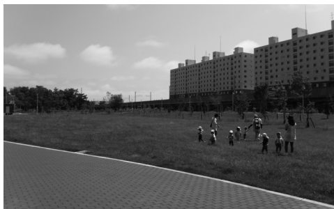
集いの広場は芝生となっており、地域イベント・健康づくり・遊びなどに活用できます。