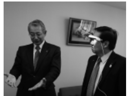
▲目に光を当てて、眠気を誘うホルモンの分泌を抑える器具「ルーチェグラス」を体験する三好市長。