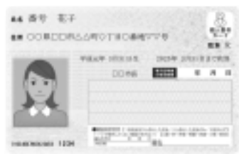
▲マイナンバーカードの見本

各種証明書のみを請求される方は、証明交付窓口または市役所本庁舎夜間証明交付窓口、あるいはマイナンバーカードや住民基本台帳カードのコンビニ交付サービスをご利用ください。※転入転出などの異動届はお受けしていません。