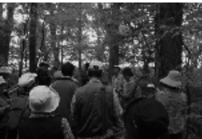
市内に113か所ある名木のうち一部を巡るバスツアーの参加者