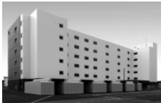
問 建築住宅課 ☎ 381・1041

られていた「新栄団地C棟」が11月に完成します。新しい団地は太陽光発電を導入(発電は共用部に使用)し、二酸化炭素の排出量の削減や災害時の電力確保など、環境や災害対応に配慮した設計です。完成後は現在新栄団地にお住まいの方が転居し、空き室が出た場合には広報えべつ11月号で新規入居者を募集。