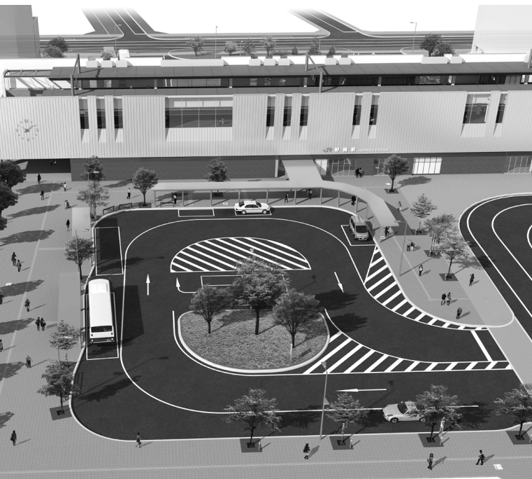
野幌駅前南口広場完成予想イメージ図（平成30年度完成予定）