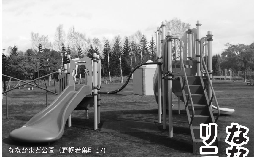
ななかまど公園（野幌若葉町57）