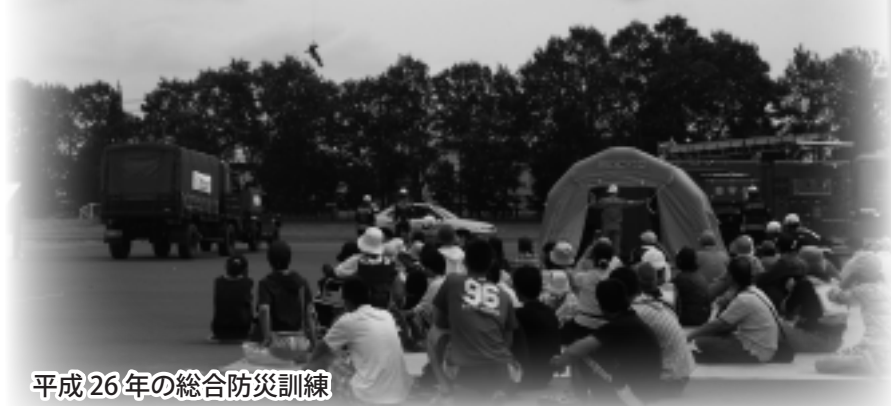
平成26年の総合防災訓練