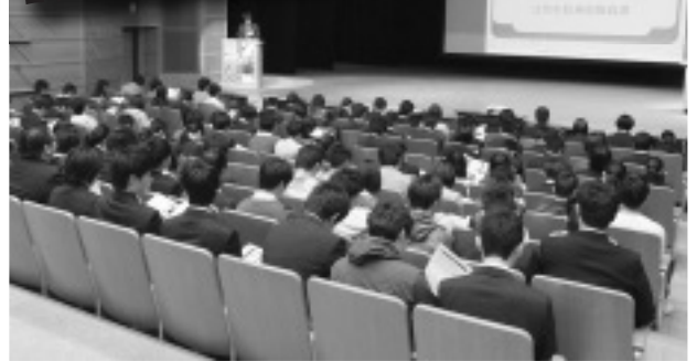
昨年の職員採用ガイダンス

このガイダンスでは、平成27年度第2回江別市職員採用試験の概要説明のほか、市の概要や具体的な仕事内容なども紹介する予定です。