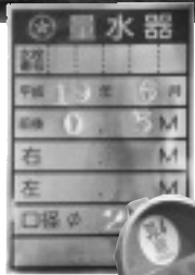
←地下式メータの表示プレート 平成19年6月にメータを設置した表示プレート