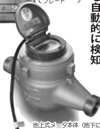
地上式メータ本体（地下に設置）

平成27年度から8年計画で、水道メータの取り替え時に、地上式（電子式）メータを設置していきます。