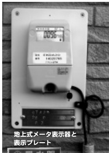
地上式メータ表示器と表示プレート